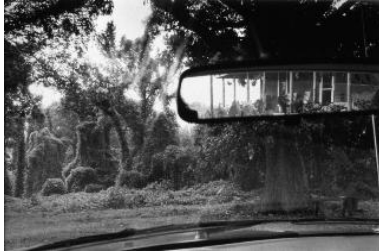
Gilles Mora, Alabama