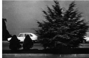
Jean-Marc Bustamante, No man's land n°2