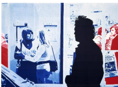
Gérard Fromanger, Bleu Saphir