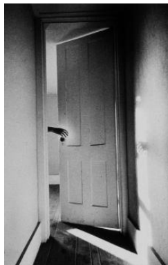
Ralph Gibson, Hand through door (Somnambulist)