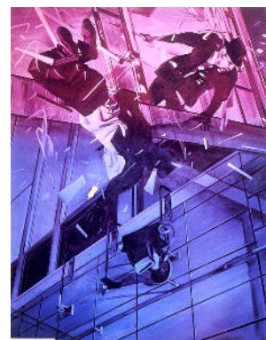
Jacques Monory, Catastrophe n°4