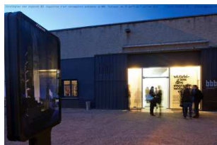
LE BBB CENTRE D'ART

Le BBB, c'est actuellement un espace d'exposition de 300 m2 et des projets extérieurs (dans l'espace public ou structures partenaires). Un logement pour les artistes accueillis est mis à disposition par la ville de Toulouse.