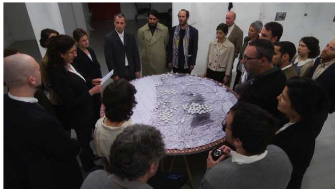
Λέγηση : Αριέλλα Αζούλαγ, « Civile Alliances, Παλαιστίνη 47-48 », ταινία, 52min, 2012

Ο έργο της Αριέλλα Αζούλαγ θα λάβει την μορφή μιας εγκατάστασης σκηνολογημένης από μια επιλογή ταινιών στο χώρο του κέντρου τέχνης. Το σύνολο των έργων και των δημοσιεύσεων θα παρουσιαστεί στο κοινό.