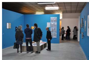
Vue de l'exposition, Autopiste, 2011