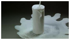
UN MONDE QUI S'ACCORDE à NOS DÉSIRES BORIS ACHOUR vidéo 35 mm transféré en vidéo, muet, 1'36", 2000 - production Les Abattoirs, Toulouse