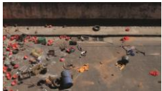
« Ο Σέκυλο » < THE «ENLURY» > Cinthia Marcelle Vidéo, 4min44, 2011 édition : 3/5 courtoisie Cinthia Marcelle production Katásia Filmes et 88 soutien de Pinchuk Art Foundation