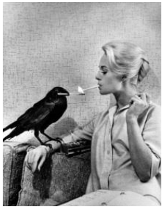
« Τίππι Ηεδρεν, Hollywood, 1962 » Philippe Halsman photographie © P. Halsman/ Magnum Photos