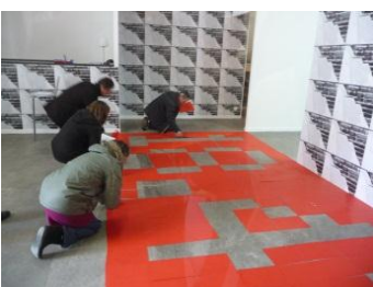
ATELIERS BBB CENTRE D'ART