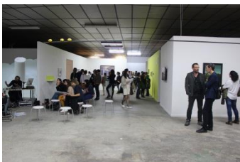
VERNISSAGE DE « COLLECTIVE COLLECTION », BBB CENTRE D'ART