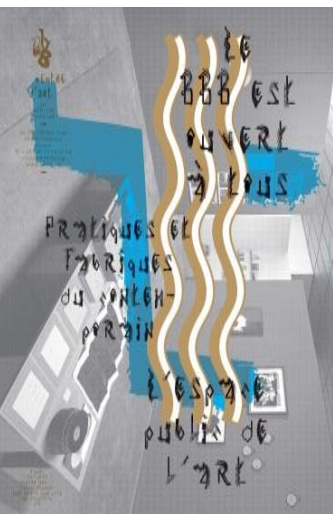
AFFICHE BBB CENTRE D'ART

Ouvert à tous depuis 1994, le BBB centre d'art développe un programme d'expositions, d'évènements et d'actions d'éducation artistique et culturelle en art contemporain. Il est également une plateforme ressource pour les artistes et professionnels du secteur (conseil, accompagnement, formation).