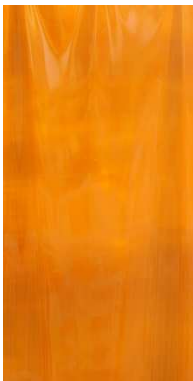
« Dedans # 211 (Rideau), société Amiel. Recadrée. Porte-Image. Borderouge Nord. Place Carré de la Maourine. Toulouse 2013, 2015 » Alain Bernardini Commande publique de photographies du Cnap | production BBB centre d'art

Qu'elles soient picturales, architecturales ou sculpturales, la Renaissance voit naître un grand nombre d'œuvres issues du mécénat royal. Ancêtre de la Commande publique, le mécène orientait fortement la production de l'artiste, ce dernier ayant une marge de manœuvre assez réduite quant au contenu de son œuvre. Aujourd'hui, la commande publique ne se fait plus dans un dialogue binaire entre un artiste et un commanditaire unique. C'est une coproduction à plusieurs voix – différents représentants culturels de l'État, centre d'art, médiateurs privés, artiste, etc. – permettant ainsi la création d'œuvres très diverses et mieux contextualisées sur le territoire public.