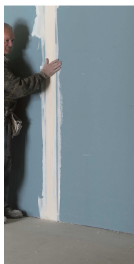
« Le Touché # 1, Anonyme , chantier Metronum. Recadrée. Porte-Image. Borderouge Nord. Place Carré de la Maourine. Toulouse 2013, 2014 » 1 er accrochage – sept. 2014-mars 2015 Alain Bernardini Commande publique de photographies du Cnap | production BBB centre d'art