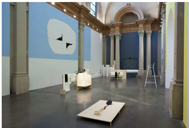
Vue d'exposition « Olivier Nottellet, à peu de chose près », Chapelle Saint-Jacques, Saint-Gaudens, 2015