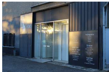
Façade du BBB centre d'art