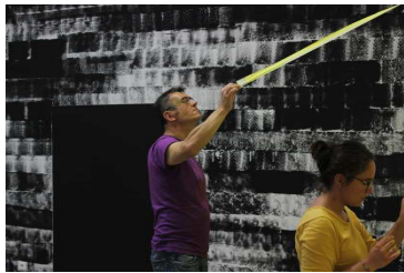
OLIVIER NOTTELLET « ZONE DE RALENTISSEMENT » Montage de l'exposition