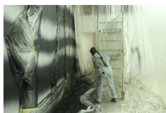
MONTAGE EXPOSITION « TROUBLE EN PEINTURE » Mars 2015