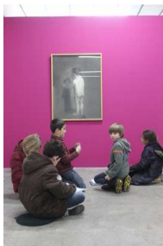
VISITE D'EXPOSITION « COLLECTIVE COLLECTIVE LAURENT FIÉVEL, VOLÉ ] » Atelier, passeport pour l'art.

Le BBB, c'est actuellement un espace d'exposition de 300 m2 et des projets extérieurs (dans l'espace public ou structures partenaires). Un logement pour les artistes accueillis est mis à disposition par la ville de Toulouse.